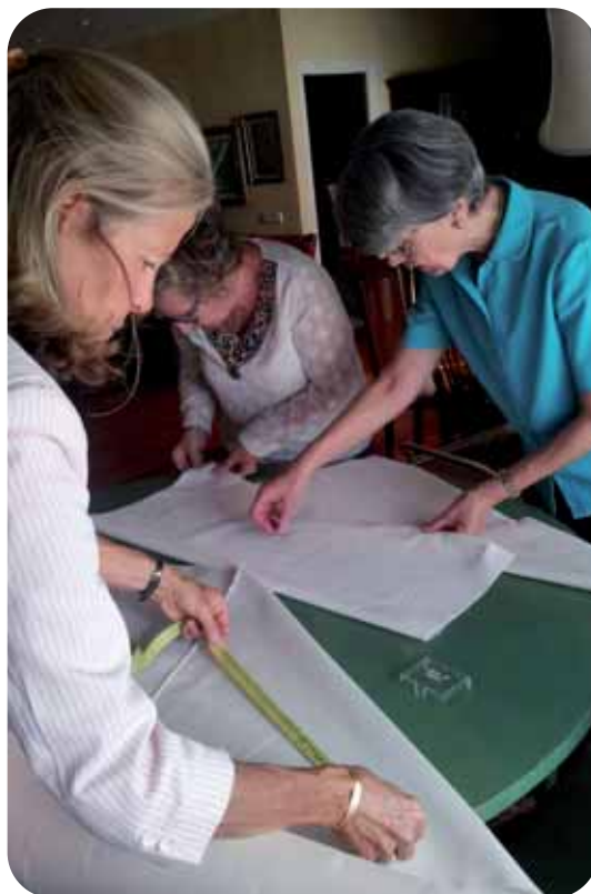
Colaboradoras del PAS en el ropero.

Las necesidades siguen siendo muchas, por ello vamos a poner nuestro trabajo e ilusión en ayudar de esta manera a la Iglesia y a las vocaciones de sacerdotes. Como nos escribe un seminarista de vuelta a su país, "pediré al Señor que sigan con este bonito apostolado que llega a todos los puntos de la Tierra". ¡Os esperamos a todos!