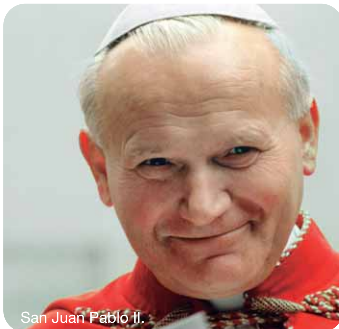
San Juan Pablo II.

Miles de jóvenes de muchas nacionalidades acompañados, en muchos casos, por sacerdotes se han reunido con el sucesor de Pedro para redescubrir la alegría del Evangelio y recibir del Espíritu Santo un nuevo impulso misionero. Cracovia nos traerá también a la memoria y a nuestro corazón el recuerdo vivo de San Juan Pablo II, modelo de Pastor que da la vida por su pueblo, modelo de Pastor testigo de la misericordia del Padre.