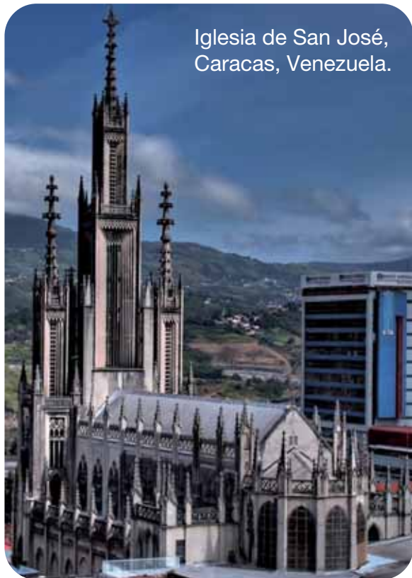
Iglesia de San José, Caracas, Venezuela.