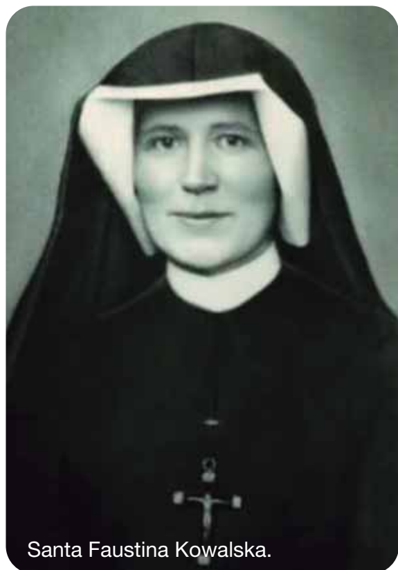
Santa Faustina Kowalska.

“CREO QUE LA DIVINA PROVIDENCIA NOS HA GUIADO PARA CELEBRAR EL JUBILEO DE LOS JÓVENES PRECISAMENTE EN CRACOVIA, DONDE HAN VIVIDO SAN JUAN PABLO II Y SANTA FAUSTINA KOWALSKA, ESTOS DOS GRANDES APÓSTOLES DE LA MISERICORDIA DE NUESTRO TIEMPO”, PAPA FRANCISCO