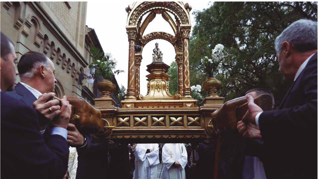
Histórica procesión de Vírgenes en Pamplona.

Desde hace más de medio siglo, esta Iglesia de Pamplona no vivía un evento mariano de tal envergadura. Los seminaristas nos sentimos bendecidos por la oportunidad que Dios nos dio de ser testigos de esta tarde de fervor cristiano.