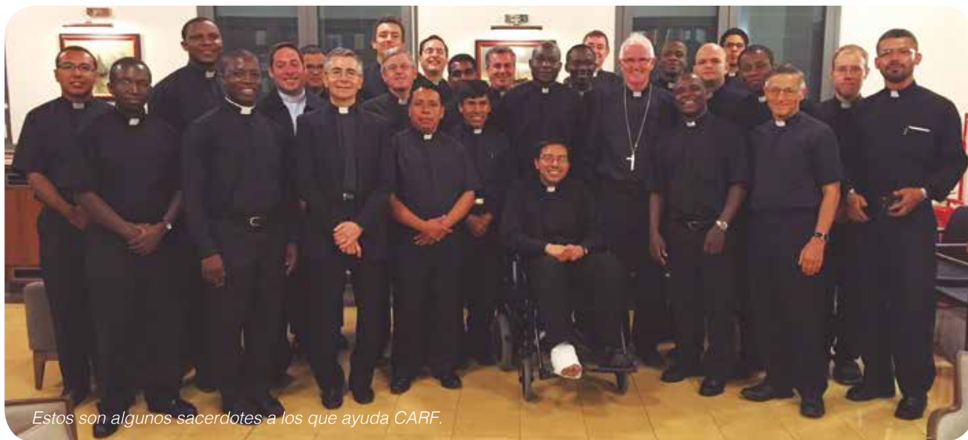
Estos son algunos sacerdotes a los que ayuda CARF.

Desde CARF queremos extender esta iniciativa a todos los benefactores y amigos. Más información en el WhatsApp CARF: 638 078 511 ó en carf@carfundacion.org