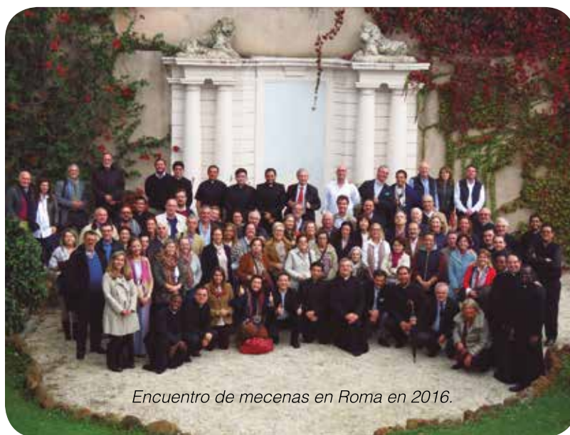
Encuentro de mecenas en Roma en 2016.

El encuentro tendrá lugar del 31 de octubre al 5 de noviembre de 2017, aunque existe flexibilidad para incorporarse al viaje según la disponibilidad de cada persona.