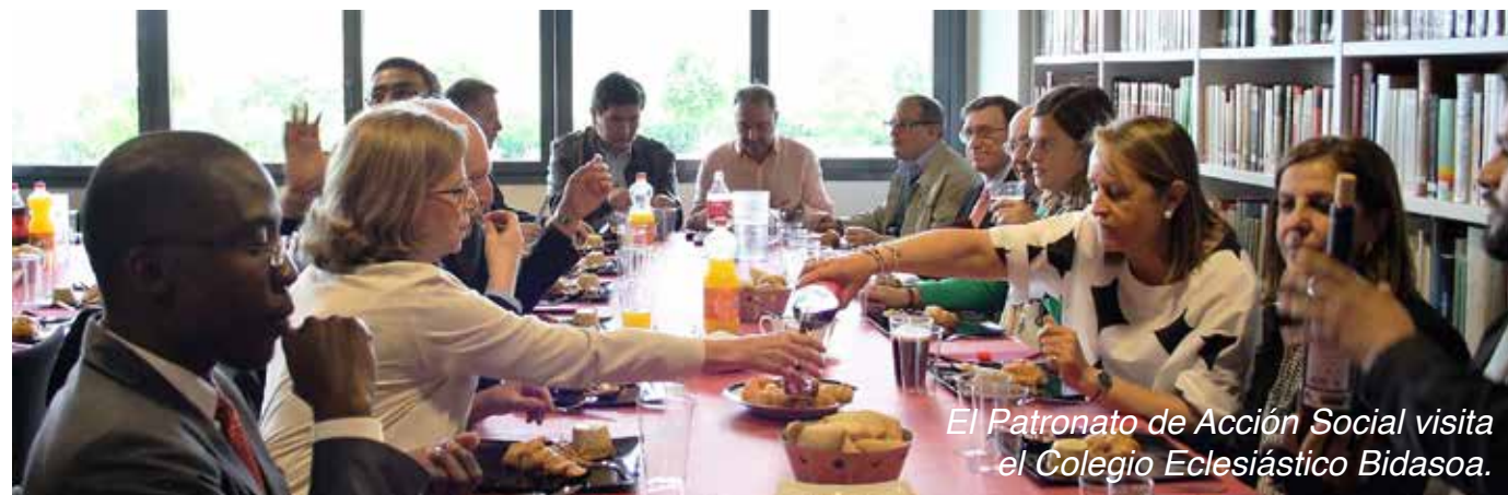
El Patronato de Acción Social visita el Colegio Eclesiástico Bidasoa.

Las personas que quieran participar o deseen donar objetos para el mercadillo, pueden ponerse en contacto: 659 05 73 20 / 659 37 89 01